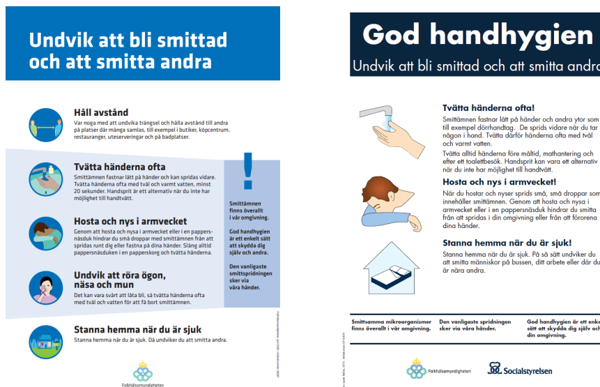
Figure 2. Posters from the Public Health Agency of Sweden and the National Board of Health and Welfare.

Precautions should continue to be applied even if employees recover from Covid-19, carry antibodies or get vaccinated, as the employee can still carry the infection without becoming ill.