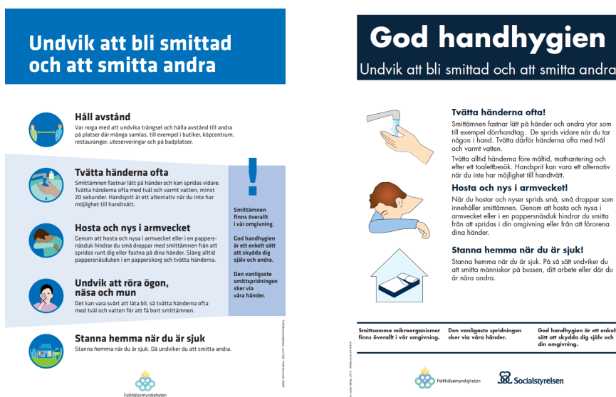
Figur 2. Affischer från Folkhälsomyndigheten och Socialstyrelsen.

Försiktighetsåtgärder ska fortsätta tillämpas även om medarbetare tillfrisknat från covid-19, bär antikroppar eller vaccinerat sig då medarbetaren fortfarande kan bära smittan men ändå inte insjuknar.